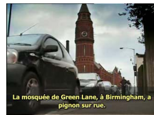
La mosquée de Green Lane, à Birmingham, a pignon sur rue.

Notre reporter s'y est rendu secrètement l'été dernier, se joignant aux milliers de fidèles. Il restera anonyme.